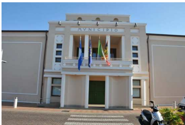
CITTA' DI CAORLE (VE)